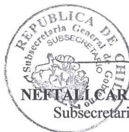
NEFTALÍ CARABANTES HERNÁNDEZ Subsecretario General de Gobierno