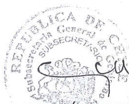
NEFTALÍ CARABANTES HERNÁNDEZ Subsecretario General de Gobierno