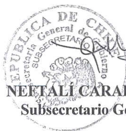
NEFTALÍ CARABANTES HERNÁNDEZ Subsecretario General de Gobierno