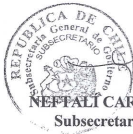
NEFTALÍ CARABANTES HERNÁNDEZ Subsecretario General de Gobierno