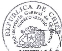
NEFTALÍ CARABANTES HERNÁNDEZ Subsecretario General de Gobierno