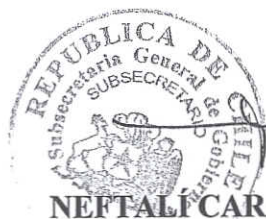
NEFTALÍ CARABANTES HERNÁNDEZ Subsecretario General de Gobierno