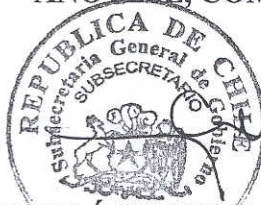
NEFTALÍ CARABANTES HERNÁNDEZ Subsecretario General de Gobierno