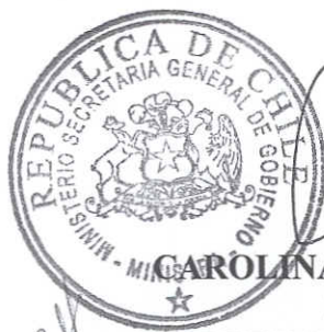
CAROLINA TOHA MORALES MINISTRA SECRETARIA GENERAL DE GOBIERNO

ANÓTESE, TÓMESE RAZÓN Y REGÍSTRESE POR ORDEN DE LA PRESIDENTA DE LA REPUBLICA