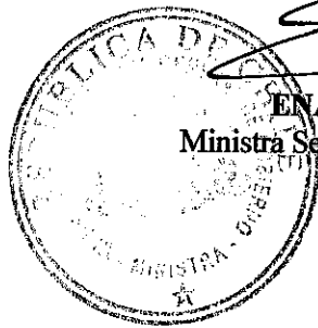
ANA VON BAER JAHN Ministra Secretaria General de Gobierno

“POR ORDEN DEL PRESIDENTE DE LA REPÚBLICA”